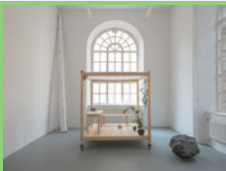
石は思った 2019

(右) BALD BINICH WEG 2005