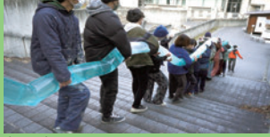
水を運ぶ 2023

1998 大阪府生まれ 2023 京都市立芸術大学 美術学部 美術科 彫刻専攻 在学中