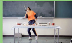
ニューズ〜つプロジェクト 2022

2017 多摩美術大学 情報デザイン学科 メディア芸術コース 卒業 2019 多摩美術大学 同学科 同コース研究室 副手 2023 京都市立芸術大学 大学院 美術研究科 彫刻専攻 修了 2023 京都市立芸術大 学 総合基礎実技 非常勤講師