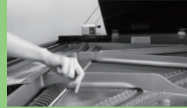
letters on the air 2021

1999 石川県生まれ 2022 京都市立芸術大学 音楽学部 音楽学科 声楽専攻 卒業 2022 京都市立芸術大学大学院 美術 研究科 構想設計専攻 在学中