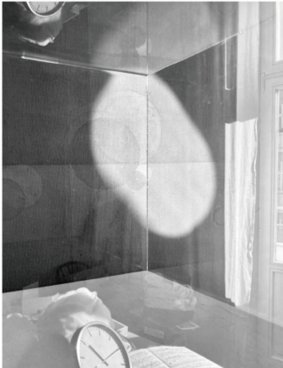
Elusiveness of Shadow