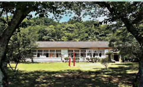
自遊学校 (旧竜ヶ迫小学校)