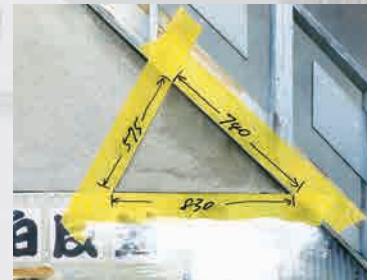
角度の考察(エスキス)