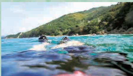
《海面になる練習》(映像から)