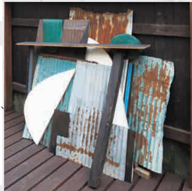
《傾きのレッスン》(エチュード)

会場に置かれた地図を頼りに +1~+2 のあいだを散歩し、傾きに関わる興味深いモノのありようを特設サイトにアップして下さい。画像、テキストなど方法は自由。本サイトは会期中公開します。詳細はホームページをごらん下さい。